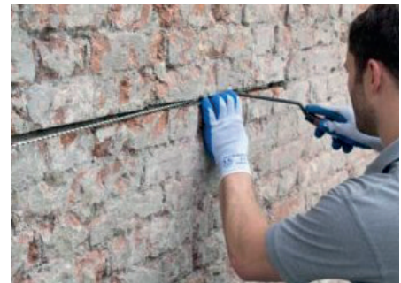
Rénovation d'un mur fissuré.