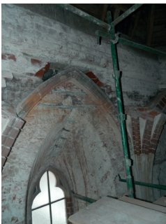
Rénovation d'une église.