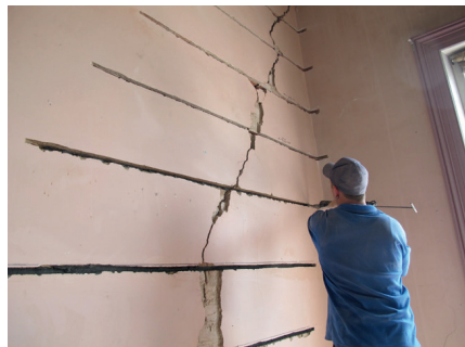
Refixation du mur intérieur avec le mur extérieur.